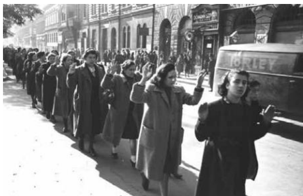
Letartóztatott zsidó nők a budapesti Wesselényi utcában 1944. október 20–22-e körül 99