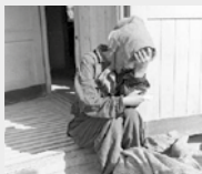
Tüdőfoglyó nő az egyik barakk előtt