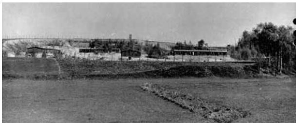
A penigi altábor elülső nézete, a 3. amerikai hadsereg egy ismeretlen tagjának felvétele, 1945 121