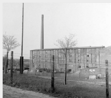
A kényszermunka színhelye, a Max Gerth-művek Penigben 1945-ben

Penigben a fogva tartás egész ideje alatt megfogyott lábball a betegeknek kijelölt barakk részben feküdtem, nagy fájdalomaim voltak, semmiféle gyógyszert nem kaptam. Papírkötszereiből nem volt elegendő, a kötést nem lehetett kicserelelni, így a lábam állapotja rosszabbodott. Sokan tifuszban, akut hasmenésben és différiában haltak meg. Teljesen eltervesztünk, a testünket centiméter vastag sebek borították, a papírkötszereket átütött a genny. Egy fogorvosnő próbált meg a legjobb tudása szerint gyógyítani, de gyógyszerek és a megfelelő szaktudás hiányában a legjobb szándékkal sem tudott rajtnk segíteni.