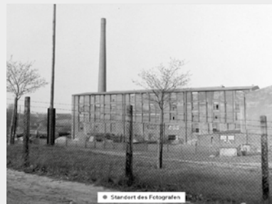
A kényszermunka színhelye, a Max Gerth-művek Penigben 1945-ben