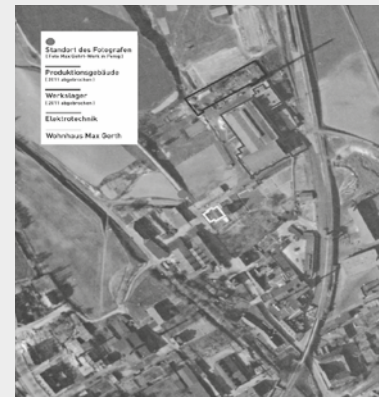
Légi felvétel a penigi altáborról 1945. április 10-én