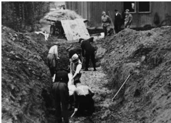
Egykori NSDAP-tagok kiássák a táborban elföldelt tizennégy holttestet, 1945. szeptember 233