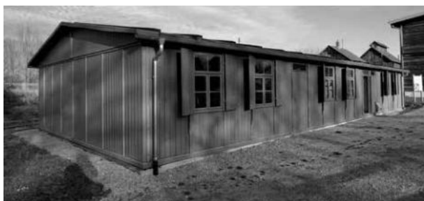
RL IV/3 típusú barakk, Hohenloher Freilandmuseum Wackershofen, 2015 114

A langenleuba-oberhaini tábor építéséről létezik egy 1944. augusztus 15-ei keltezésű, titkosított helyszínrajz, amely eredetileg kilencszáz fős baraktáborral számolt. Eszerint hét szállás-, egy gazdasági, egy mosoda- és három illemhelybarakk került volna a területre. Későbbi bővítéshez a helyszínrajzon még egy szállásbarakot képzeltek. 112 A szatellitábor építésére az engedélyt a szászországi birodalmi kormányzó, Martin Mutschmann illetékes osztálya adta meg. Közvetlenül ezután megkezdődhetett az építés Chemnitz és Lipcse között, a Reichsstraße 95. (ma Staatsstraße 57.) alatti homokbányában. 113 Nem világos, hogy az építkezést helyi cégek vagy a Birodalmi Munkaszolgálat végezte. A helyszínrajz útmutatójában (bal alsó sarok) szerepelnek a tervezett épületek, amelyek mindegyike a Birodalmi Munkaszolgálat épületeinek megnevezését viseli.