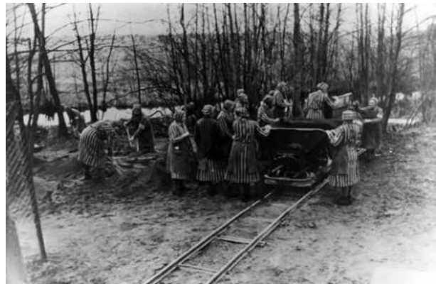
A ravensbrücki koncentrációs táborban Jehova tanúi nők megraknak egy csillét, 1939-40 8

1943-tól szinte valamennyi koncentrációs táborba (KZ) zárt fogoly hadiipari kényszermunkát végzett. Nemcsak csak zsidó nők és férfiak, hanem más csoportok is, amelyek tagjai nem illettek a nemzetiszocialista világgépbe – politikai ellenfelek, homoszexuálisok, Jehova tanúi. A „Nagynémet Birodalomban” a kényszermunkát végző KZ-foglyok száma meghaladta az 1 milliót.