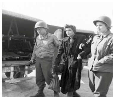
Az amerikai hadsereg katonái kísérnek egy tőlőt a mentőautóhoz