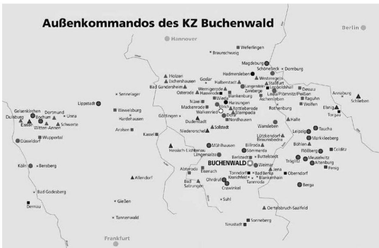
A buchenwaldi koncentrációs tábor külső táborainak a térképe 44

Nikolaus Wachsmann nagyságuktól függetlenül, feladatuk szerint osztja a külső lágereket építkezési, illetve termelő táborokra. 45 Az építkezési lágerekben gyakran abból állt a foglyok kényszermunkája, hogy gyárakat és bunkereket építettek, árkokat és föld alatti járatokat ástak, vagy a bombázások utáni romokat takarították el. A termelési táborokban ellenben a KZ-foglyok a fegyveripar követelményeit teljesítették, például lőszert és elektromos elemeket gyártottak, vagy tankokat és rakétákat szereltek össze. 46 A fegyvergyárakban dolgozó foglyok némileg elviselhetőbb körülmények között dolgoztak, de sokszor egészségre káros anyagok hatásainak voltak kitéve, minden védőfelszerelés nélkül. Ezzel szemben a kényszermunka az építkezési lágerekben „halálkommandónak” számított: a foglyoknak szabad ég alatt, az időjárásnak kiszolgáltatva