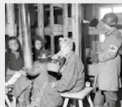
Tüdőfoglyó nőket láttnak el az amerikai hadsereg ápolói