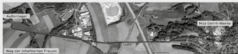
A Google Térkép 2020-as műholdfelvételén a Max Gerth-művek, a külső tábor egykori területe és a foglyi nők útvonala

Az alapulást és az időjárási viszonyoknak nem megfelelően öltözött kényszermunkások a tábor és az üzem közti utat gyalog tették meg. A hét minden napján a legtöbb kényszermunkás három műszakban, napi nyolc órában, szünetek közbeiktatása nélkül dolgozott. A kényszermunka alapvetően a német hadipar számára gyártott repülőgépalkatrészek előállítását jelentette. A foglyok közül néhányat fordítási feladatokra, tolmácsolásra, irodai vagy konyhai munkára választottak ki. Jelelegi tudásunk szerint körülbelül harminc lány és asszony vesztette életét a penigi altáborban a fogva tartási és a kényszermunka körülményei következtében a tábor területén, a halálménben vagy a felszabadulás után. Senkit nem vontak büntetőjogilag felelősségre az itt elkövetett bűnökért.