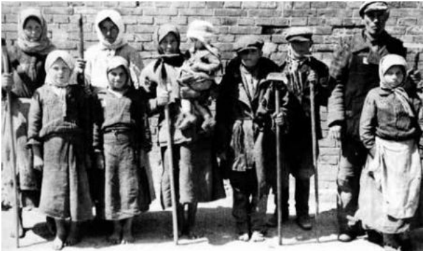
Ukrán nagycsalád kényszermunkán 6