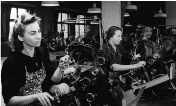
Francia kényszermunkásnők a Siemens tekerescgyártó részlegében, Berlin 1943 7