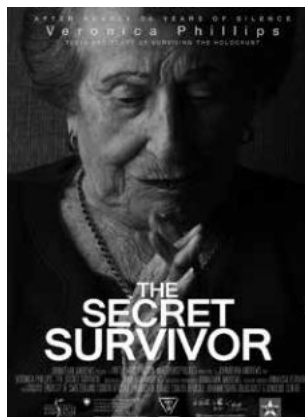
A titkos túlélő című film plakátja, 2018 200