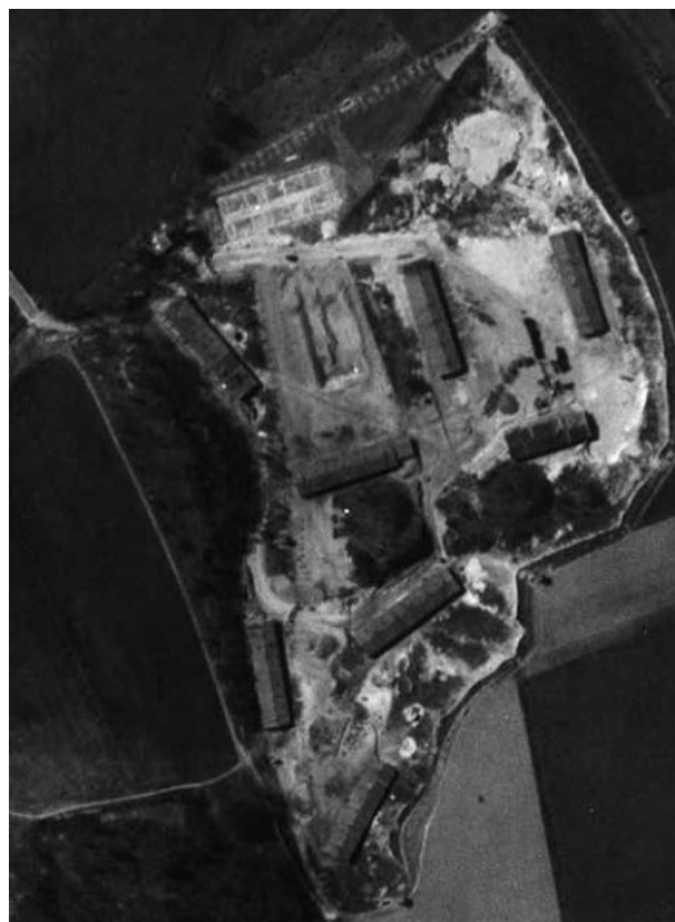
Szövetségesek légi felvétele a penigi altáborról 1945. április 10-én 116

Az amerikai hadsereg által 1945. április 10-én készített légi felvételek azt mutatják, hogy az eredeti tervek bizonyára megváltoztak, és az épületek végül a tervezettől eltérően épültek meg.