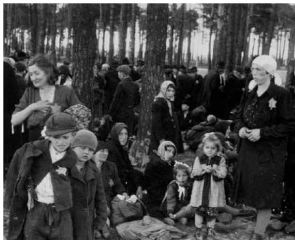
Magyar zsidó nők és férfiak várokoznak meggyilkolásuk előtt egy erdőben a 4-es számú gázkamra mellett Auschwitz-Birkenauban 1944 májusában 90

1944. május 15-én Északkelet-Magyarországon is elkezdődtek az auschwitzi deportálások, ezek naponta két-háromezer embert érintettek.