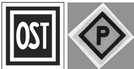
Lengyel és szovjetunióbeli kényszermunkások megkülönböztető szimbólumai

Ezért hozta meg a kormány 1940. március 8-án először az úgynevezett lengyel rendelkezéseket, majd ehhez kapcsolódva 1942. február 20-án a keletmunkás-rendelkezéseket. Mindkettő a közép- és kelet-európai kényszermunkások élet- és munkakörülményeire vonatkozó, faji alapú regresszív határozatgyűjtemény volt. Ebben fogalmazták meg például, hogy a kényszermunkásokat, nőket és férfiakat egyaránt körbekerített barakklagerekben kell fogva tartani. Kötelezettséget írtak elő stigmatizáló jelvény viseletére. A lengyel kényszermunkások esetében ez egy lila P-betű volt sárga alapon, a szovjet kényszermunkások pedig fehér OST feliratot hordtak kék alapon.