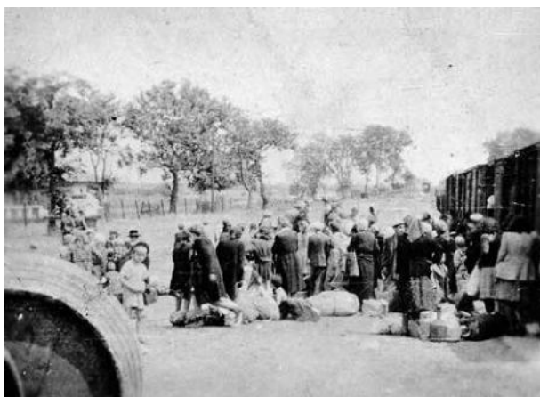
Felszállás előtt a vonatonál a deportált zsidók, Soltvadkert, 1944. június 92

1944. július 19-éig Edmund Veesenmayer magyarországi birodalmi megbízott szerint összesen négyszázharminchétezer-négyszázkét zsidó nőt és férfit deportáltak a külön erre a célra létesített öt zónából. 91 A deportáltak körülbelül kilencvenöt százalékát az auschwitzi megsemmisítő táborba küldték, ahol döntő többségüket meggyilkolták a gázkamrákban Zyklon B alkalmazásával.