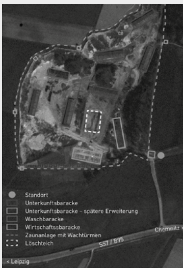
Légi felvétel a penigi altáborról 1945. április 10-én

A penigi altábor foglyait hat, egyenként százötvenöt fős barakkban tartották fogva. A tábor őrzését negyven SS-katona és tizenhét SS-alkalmazásban álló felügyelő látta el. Az egészségügyi feltételek katasztrofálisak voltak, az élelmezés, a gyógyszerellátás és a tábori ruházat elégtelen. A rossz életfeltételek a fertőző betegségek elterjedését elősegítő kártevők elszaporodásához, a tuberkulózis és a tifusz kialakulásához vezettek. Az ugyancsak fogolyként a táborba került fogorvosnő és két segítő ápolónő is nagyon szűk keretek között igyekezett enyhíteni foglyok szenvedéseit. Egy helyi orvosnő a tábor körülményeinek láttán nem vállalta a foglyok egészségügyi ellátását.